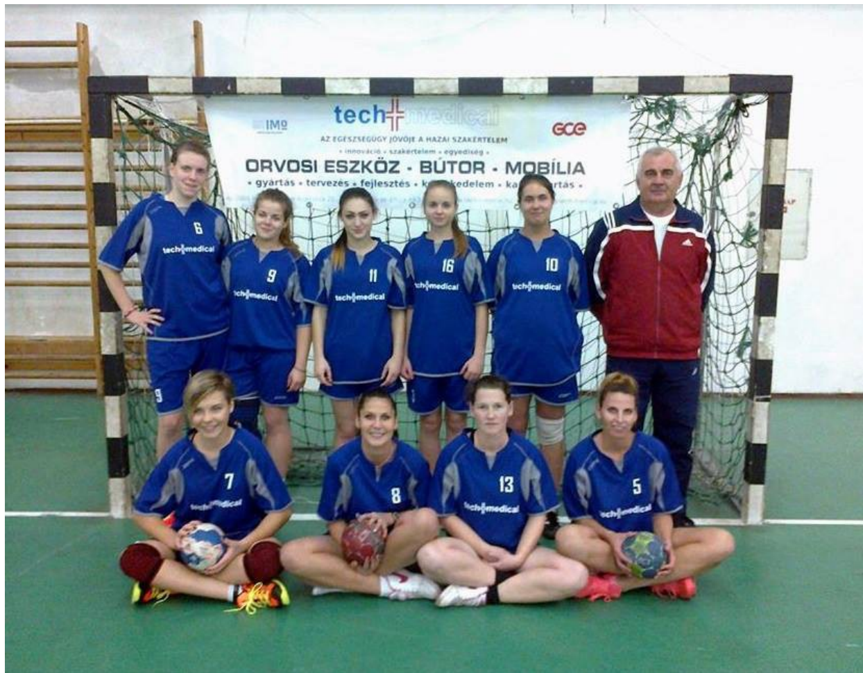
A névadó szponzor molinójával

A 2014/15. évi bajnokságban végre elértük a kitűzött célt, dobogón végzett női csapatunk. Az évekkel ezelőtti változtatás a lányoknál így eredményesnek tekinthető.