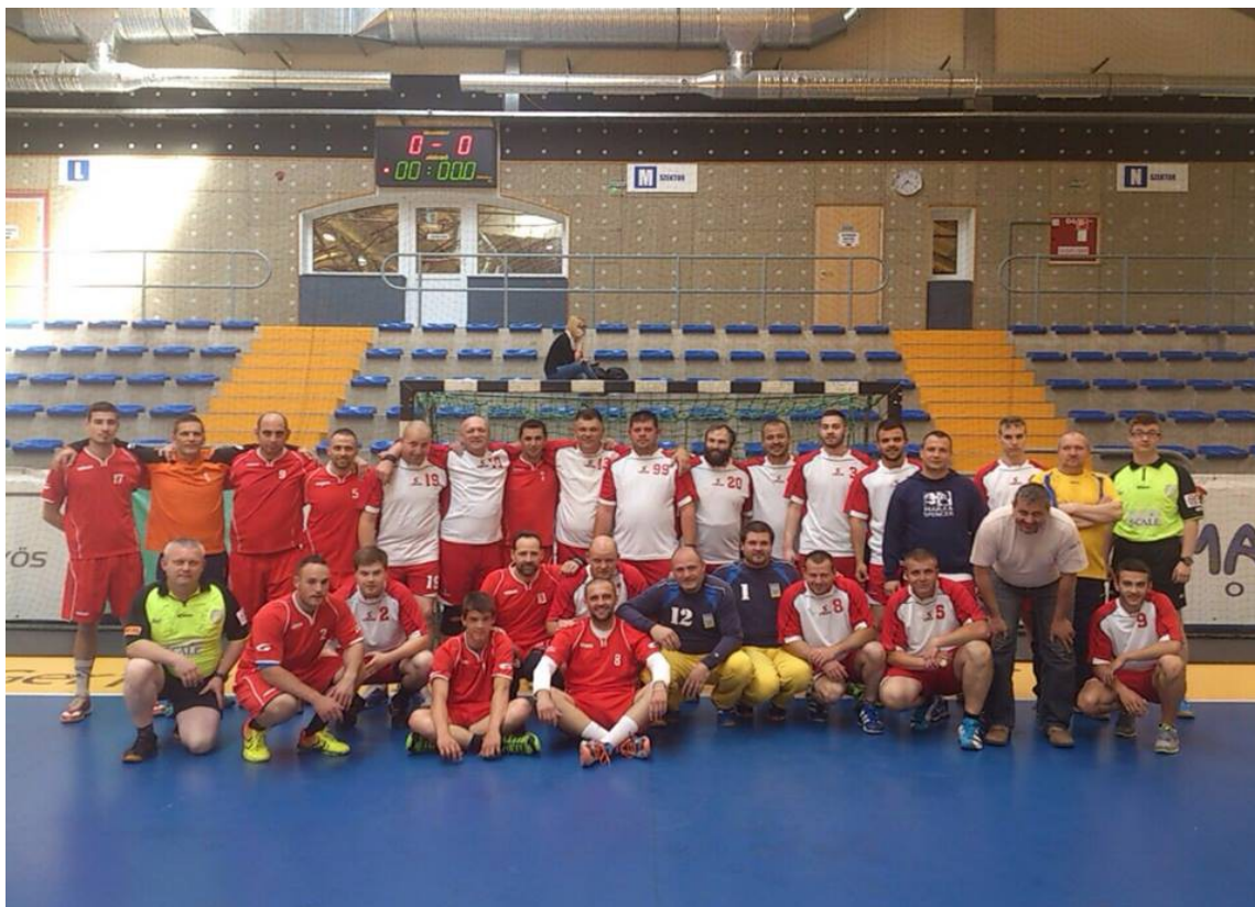
Gyöngyössolymos – Hatvani KSZSE NBIII-as mérkőzés a két csapat közös képe

Megújuló honlapunk ( www.hatvanikszse.hu ) feltöltés alatt van, reméljük fejlesztett verziója alkalmasabb lesz a tájékoztatásra.