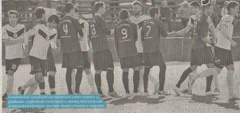
Felsőtárkányi srácokban szereplőként színe tölteni új játékosok nyithatnak majd kezét a vendég hatvaniaknak. A köszöntést követően azonban elcsúszhat a csapatok.