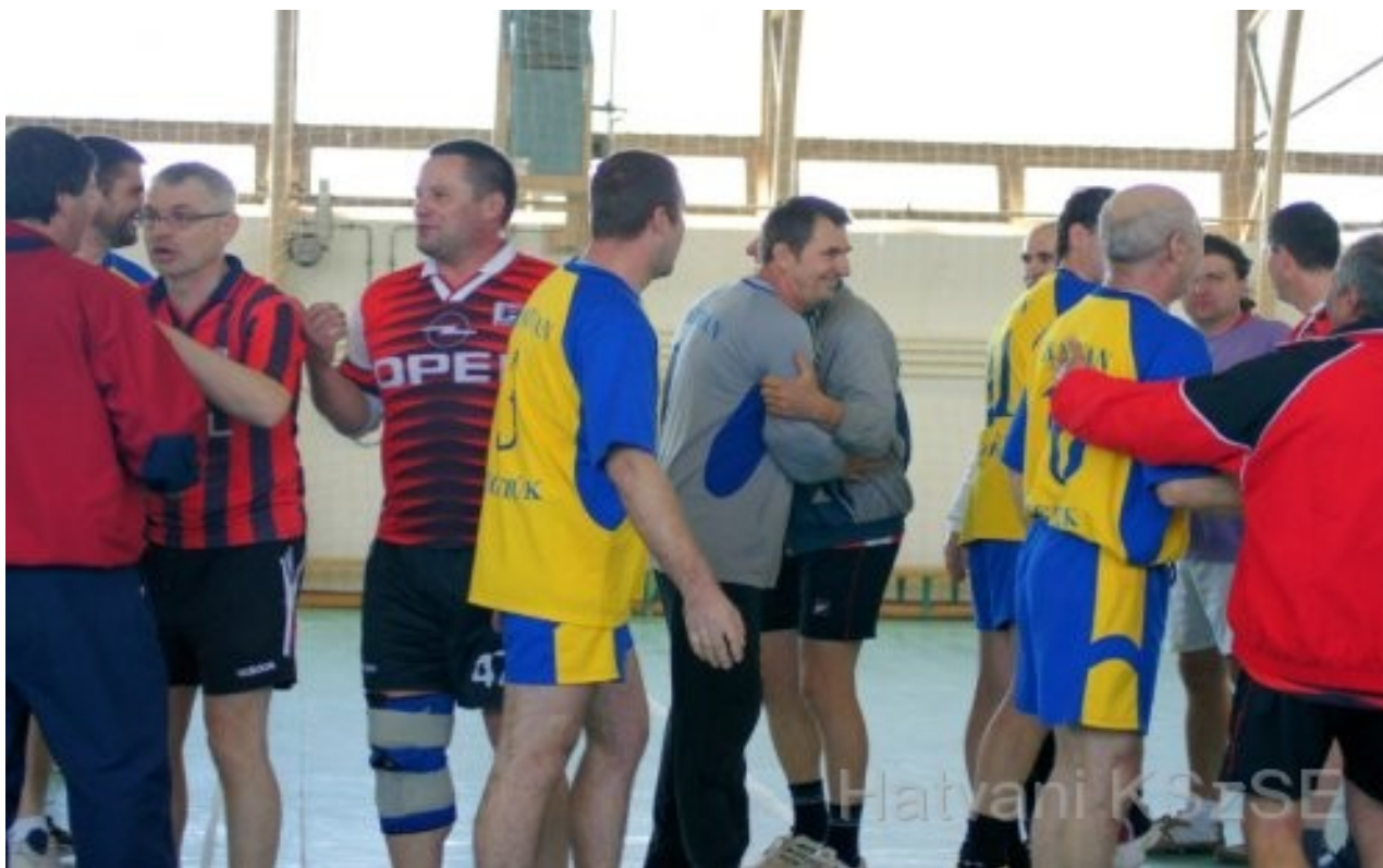
Deák László Öregfiúk Emléktorna, Hatvan. Mérkőzés utáni pillanatok.

Az Öregfiúk 2009-ben csatlakoztak egyesületünkhöz. Előtte önállóan, egyesületi keretek nélkül, baráti társaságként működtek.