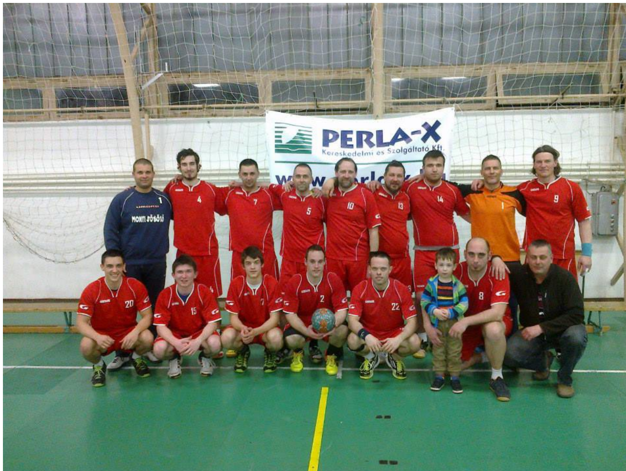
Hatvani KSZSE - Pásztó KC 34-16,(18-7) 2015. 03.28.

A 2014/15-es bajnokságban első helyen végeztünk a területi NBII-es bajnokságban, amivel újra NB II-es indulási jogot értünk el. A férfi szakág fejlődéséhez mindenképpen szükség van magasabb bajnokságban való részvételre.