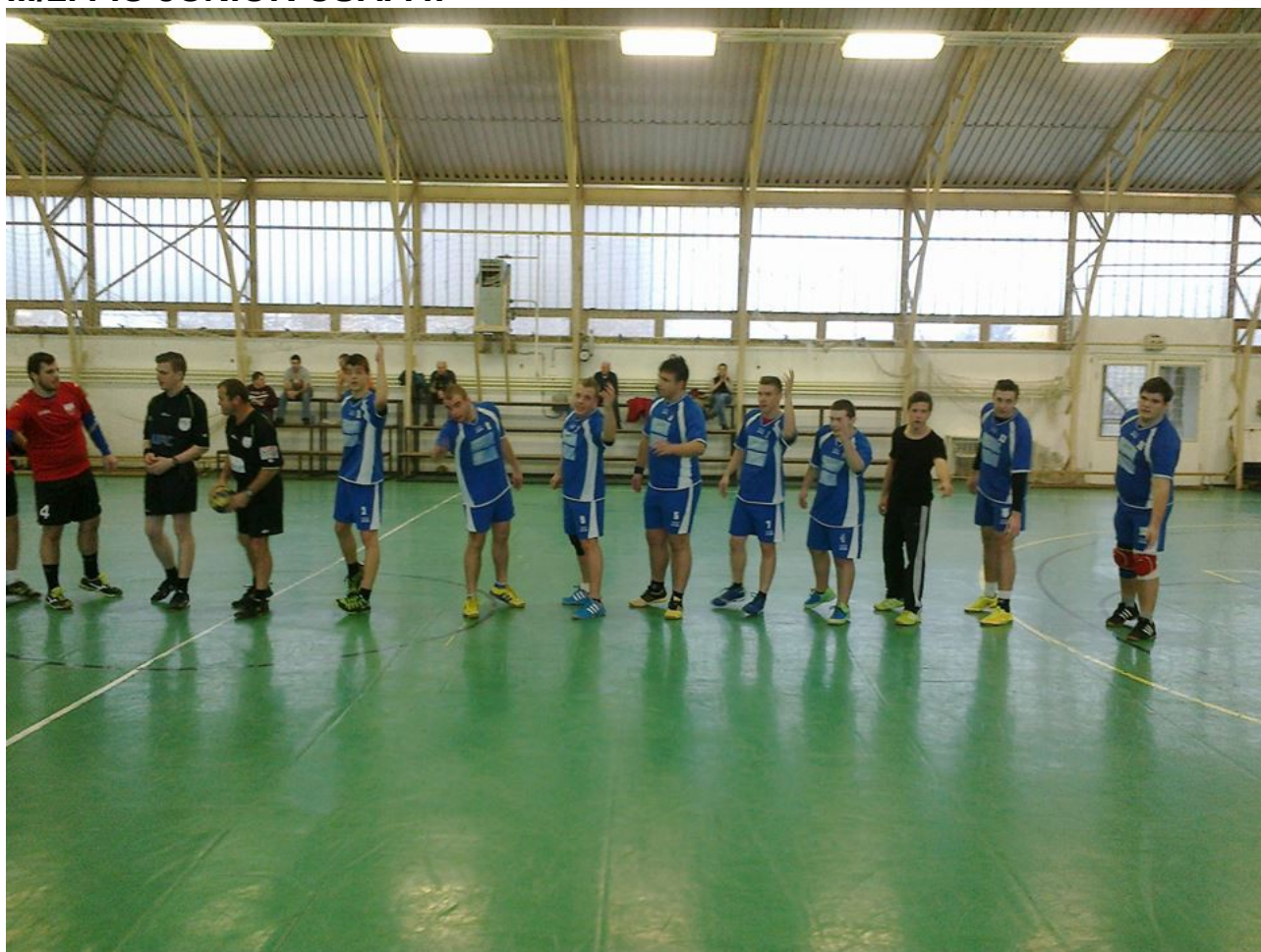
Egy hazai mérkőzés előtt