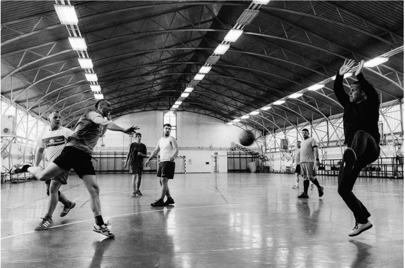
A junior csapat együtt készül a felnőttekkel. Kép egy edzésről.

A 2014/15-ös szezonban a Pest Megyei Bajnokságban vettek részt, ahol ugyanannyi a mérkőzés szám, mint korábban az NBII-ben. Pluszként jelentkezik náluk, hogy bizonyos felnőtt mérkőzéseket is a junior játszotta, sőt felnőtt bajnokikon rendszeresen szerepelnek, a fejlődésük miatt.