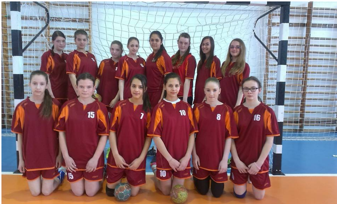
Az Országos Serdülő Lány Bajnokságban részt vevő csapatunk

Egyesületünkönél folyó utánpótlás nevelés egyik eredmény a három ezelőtt létrehozott csapat.