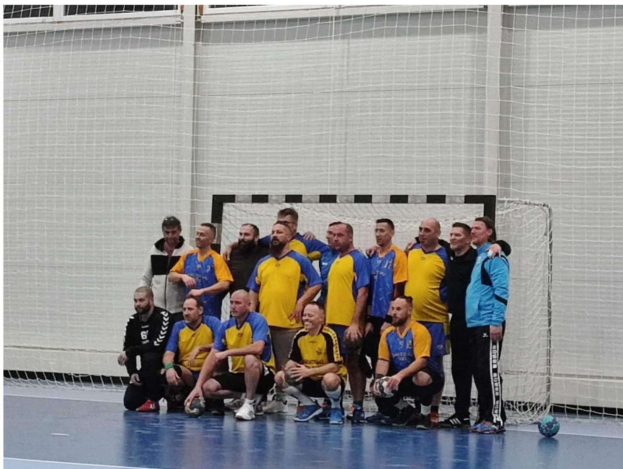
A hatvani csapat