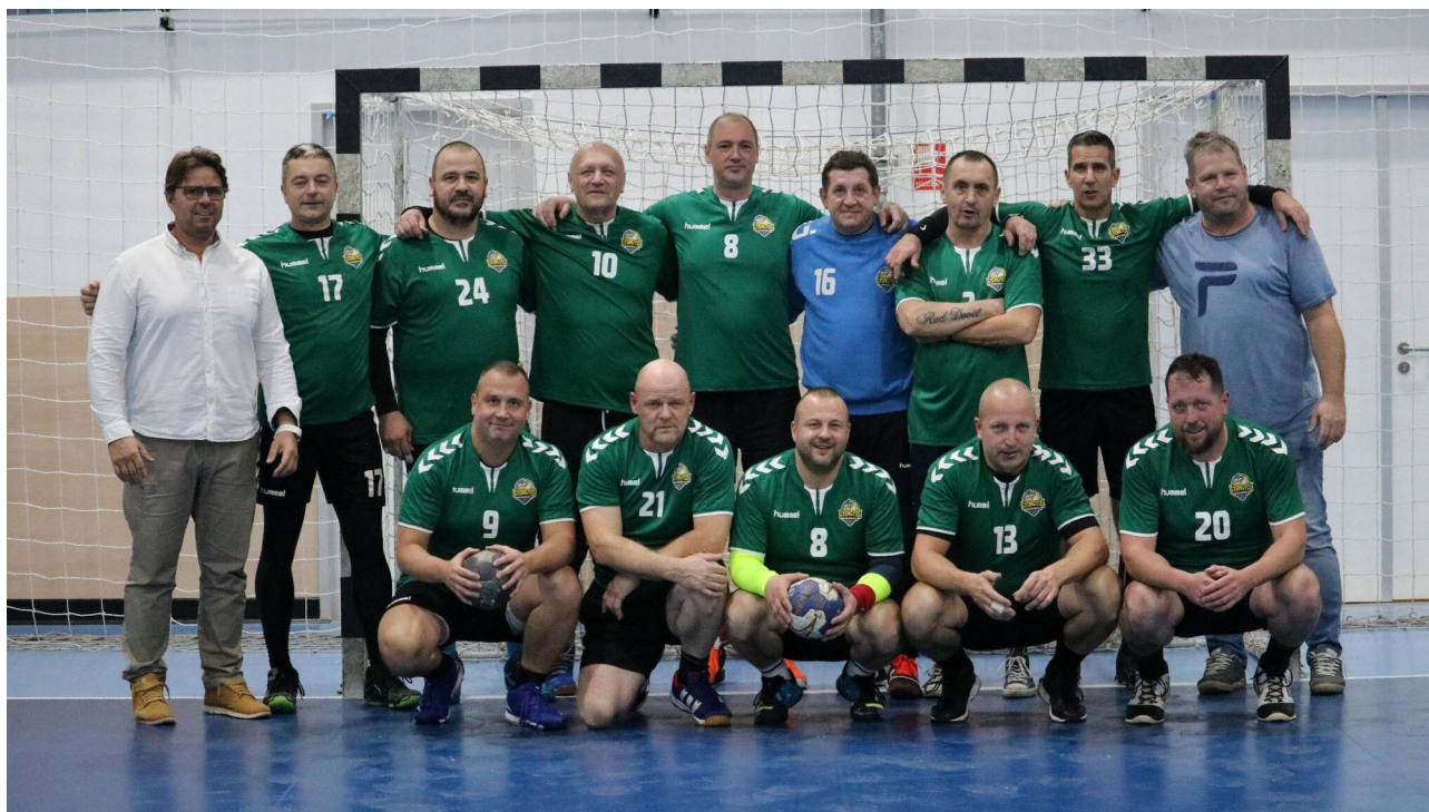
A gyöngyösi csapat

Idén került megrendezésre az 52. Hatvan-Gyöngyös Öregfiúk mérkőzés!