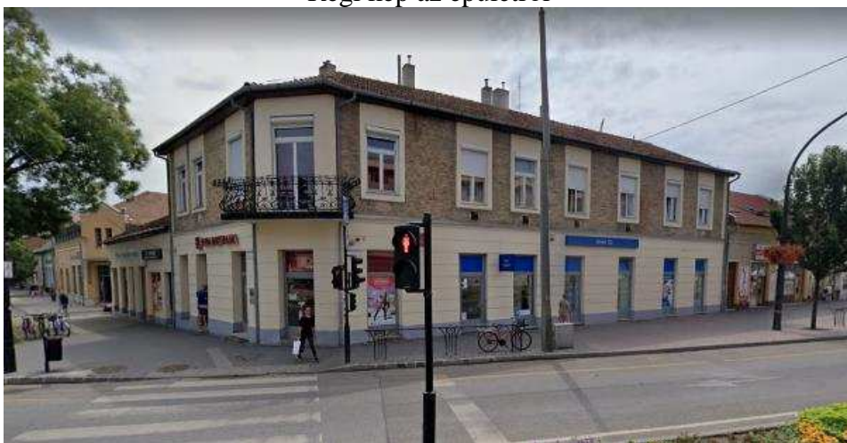
Az épület jelenlegi állapota