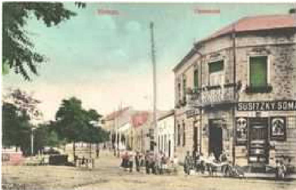
Régi kép az épületről