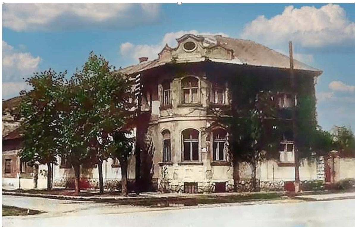
Régi kép az épületről