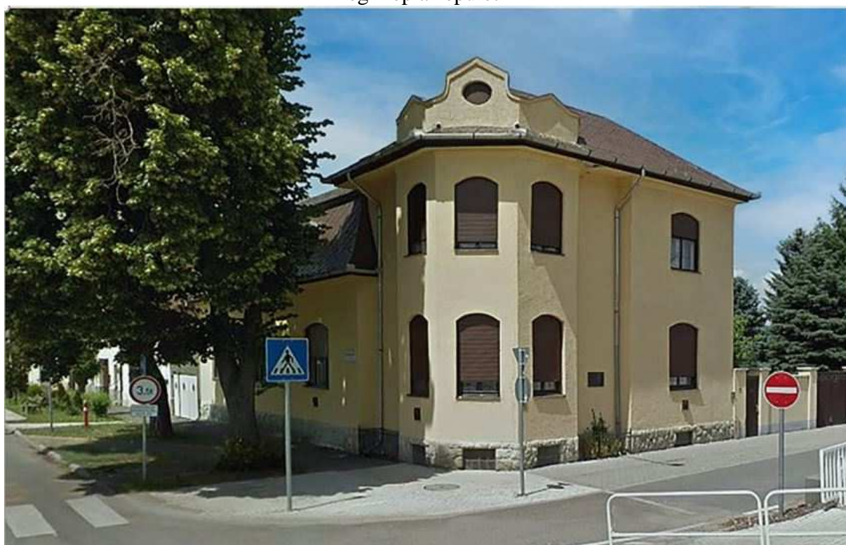
Az épület jelenlegi állapota